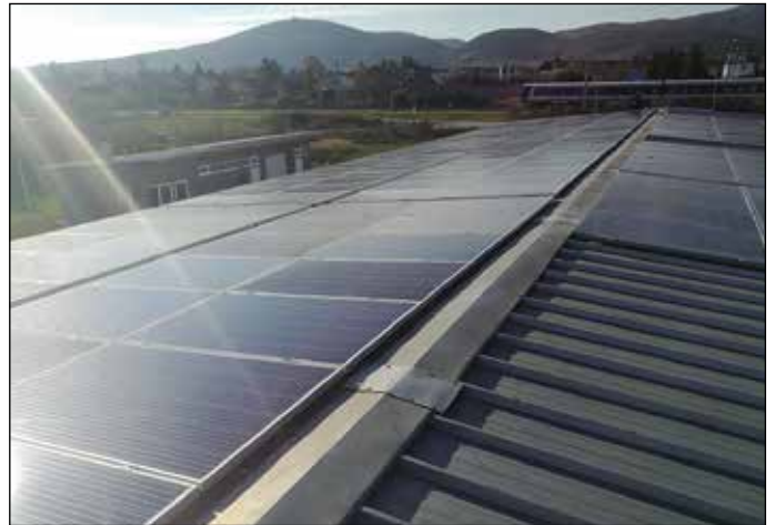
Die Anlage auf dem Bauhof-Dach ist bereits in Betrieb.

Das Photovoltaik-Unternehmen aus Wiener Neustadt hat bereits mehrere Bürgerbeteiligungsprojekte in Österreich erfolgreich begleitet wie zum Beispiel in unserer nahen Umgebung in Bad Vöslau, Baden, Berndorf, Ternitz und vielen weiteren Gemeinden.