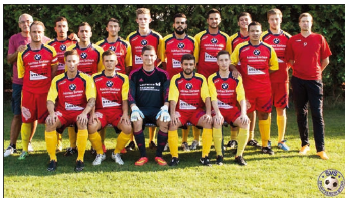
Unsere Kampfmannschaft 2015/16

Es würde uns auch freuen, wenn viele Aktive aus diesen 40 Jahren - ob Funktionäre, Spieler oder Fans - sich an ihren Verein erinnern würden und an diesem Tag mit Freunden von damals wieder treffen könnten. Da nur von einer geringen Anzahl der Aktiven aus diesen 40 Jahren Kontaktdaten vorhanden sind, wäre es super, wenn Du/Sie den einen oder anderen über dieses Jubiläum des Vereins informieren könntest.